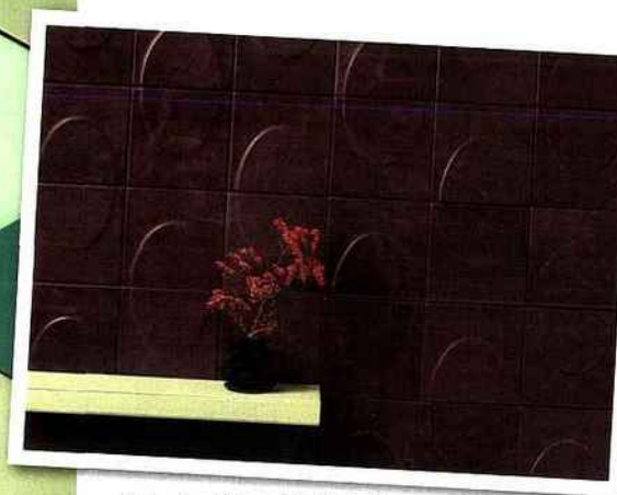
Collection Géométrie Variable, motif Arche.