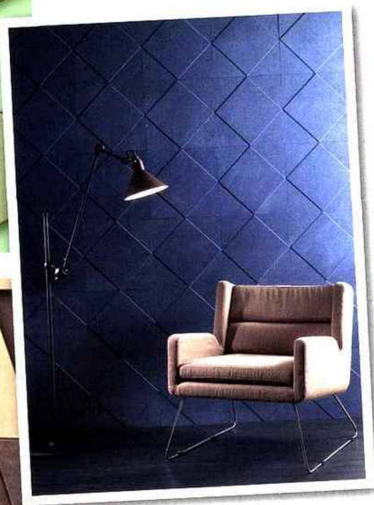
Collection Géométrie Variable, motif Losange.