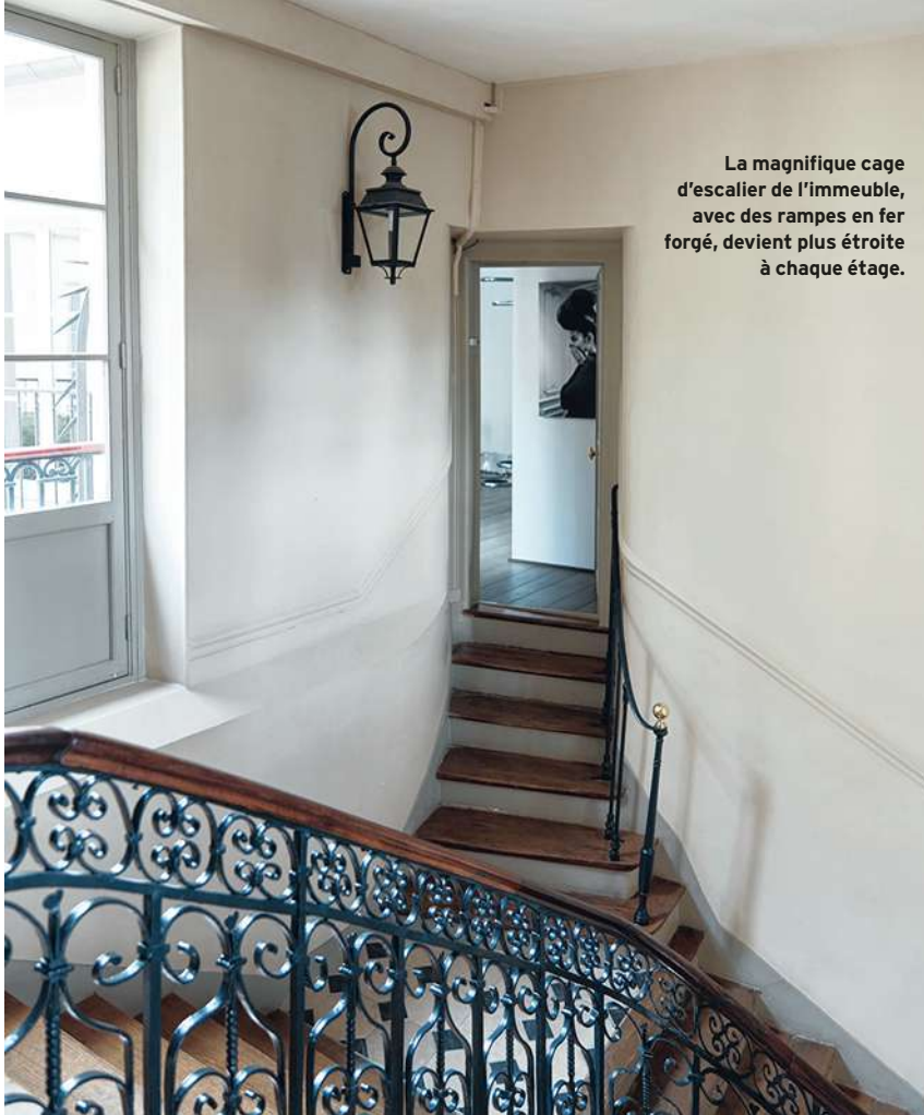
La magnifique cage d'escalier de l'immeuble, avec des rampes en fer forgé, devient plus étroite à chaque étage.