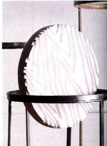
PLATEAUX EN BOIS MASSIF DE MANUEL VOLMAR ET STRUCTURES EN MÉTAL D'ÉRIC GIZARD. COURTESY ÉRIC GIZARD - MANUEL VOLMAR

« Qu'est-ce qu'un père ? Qu'est-ce qu'un fils ? Quel est le lien qui les unit ? Le sang ? L'amour ? La transmission ? L'héritage ? Je photographie des pères, de 20 à 80 ans, debout, torse nu, avec leurs fils de quelques minutes pour les plus jeunes ou entrés dans la cinquantaine pour les plus âgés. Ils sont proches, souvent peau contre peau (...) », explique Grégoire Korganow (né en 1967). Hormis quatre ou cinq clichés réalisés en France et accrochés à la MEP en 2015, l'exposition, qui a de quoi troubler, propose trente nouvelles images réalisées pour un tiers en Chine, un tiers au Brésil et un tiers en France. Les accompagnera l'ouvrage Père et fils , publié chez NEUS et recensant une centaine de photographies. Jusqu'au 25 juin , galerie du Passage, 20-26, galerie Véro-Dodat, Paris I er , tél. : 01 42 36 01 13, www.galeriedupassage.com