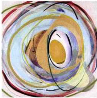
ADRIAN FALKNER, SANS TITRE (BLANC), 2016, ACRYLIQUE, ENCRE, HUILE ET BOMBE AÉROSOL SUR TOILE, 150 X 150 CM.

Adrian Falkner (né en 1979), alors connu sous le nom de Smash137, est entré dans la peinture grâce au graffiti, au milieu des années 1990, avant d'expérimenter le travail sur toile. D'abord très liées au street art, ses compositions