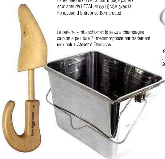
La paterre embauchoir et le seau à champagne camion à peinture 71 métamorphose par traitement inox poli. L'Atelier d'Exercices