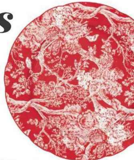
Façon couture Assiette de présentation en porcelaine de Limoges, Ø 31 cm, service « Toile de Jouy », 130 €, Dior Maison.

SÉLECTION STÉPHANIE HURÉ ET KARINE VILLAME.