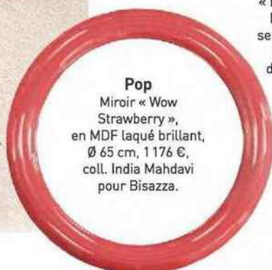
Pop Miroir « Wow Strawberry », en MDF laqué brillant, Ø 65 cm, 1 176 €, coll. India Mahdavi pour Bisazza.