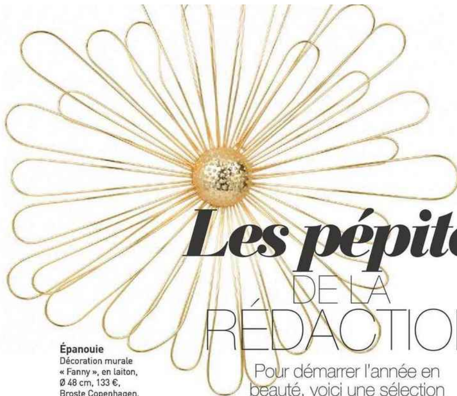
Épanouie Décoration murale « Fanny », en laiton, Ø 48 cm, 133 €, Broste Copenhagen.