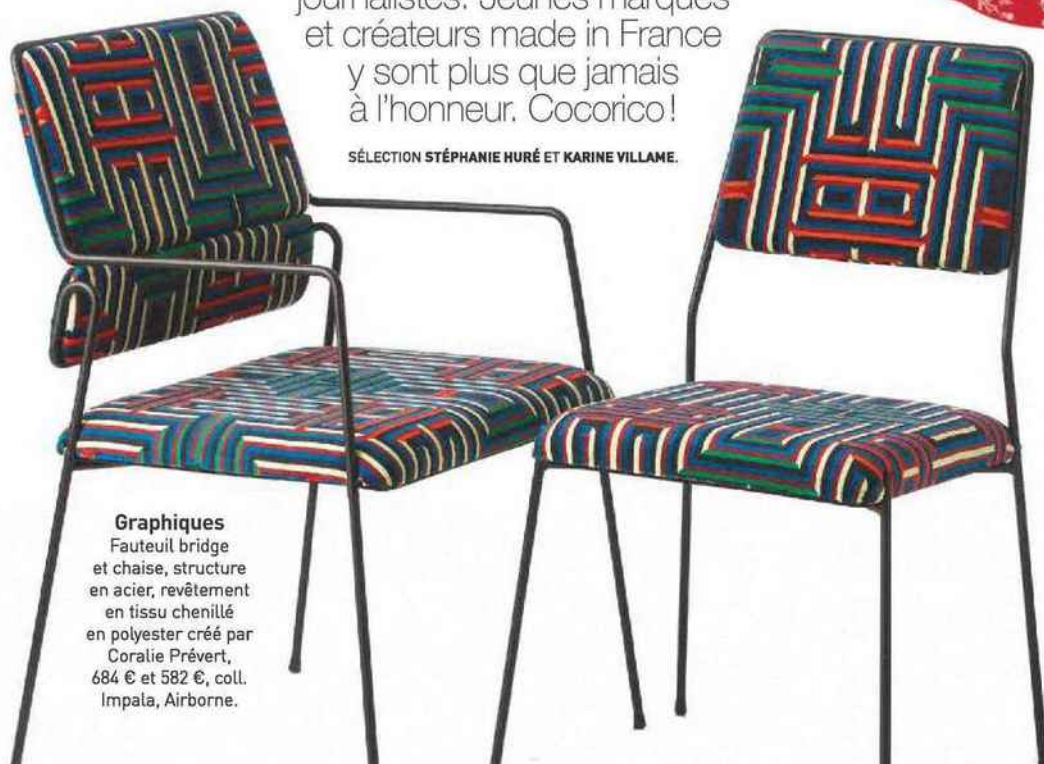
Graphiques Fauteuil bridge et chaise, structure en acier, revêtement en tissu chenillé en polyester créé par Coralie Prévert, 684 € et 582 €, coll. Impala, Airborne.