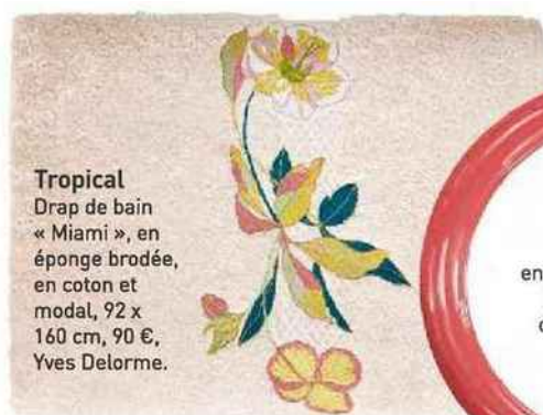
Tropical Drap de bain « Miami », en éponge brodée, en coton et modal, 92 x 160 cm, 90 €, Yves Delorme.