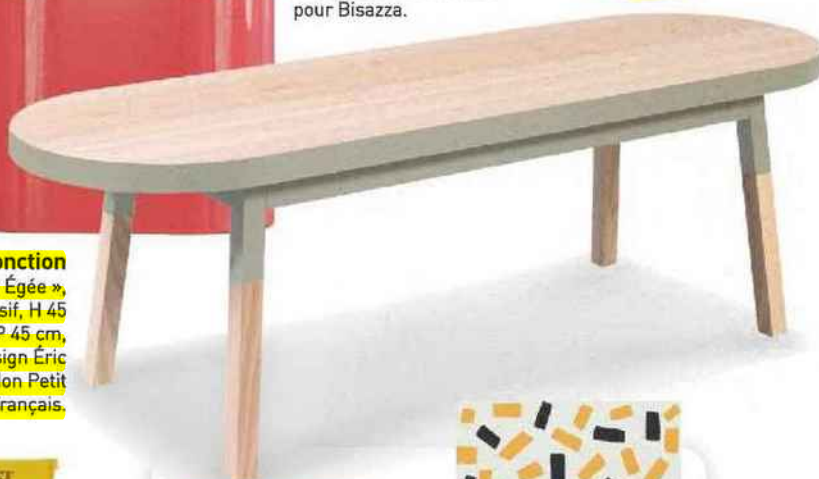
Multifonction Banc « Égée », en frêne massif, H 45 x L 140 x P 45 cm, 495 €, design Éric Gizard, Mon Petit Meuble Français.

Lavabo « Slam Strawberry », en céramique avec tiroir en bois laqué brillant, H 59 x L 65 x P 45 cm, 4 560 €, mitigeur en nickel, 558 €, coll. India Mahdavi pour Bisazza.